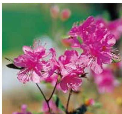
〈村の花〉エゾムラサキツツジ