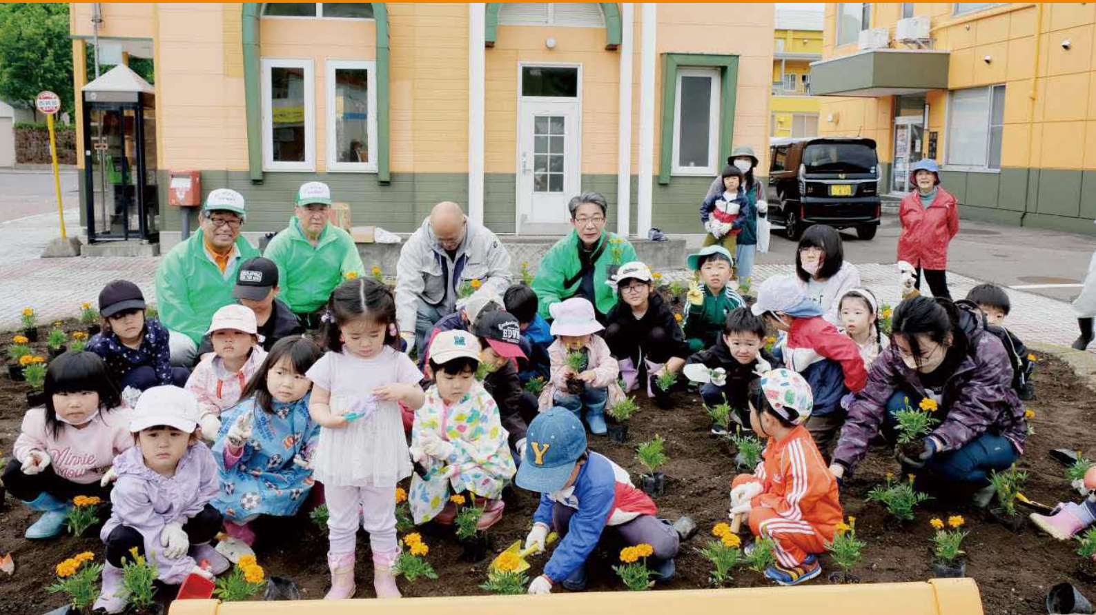
令和5年6月10日「我が村は美しく事業」