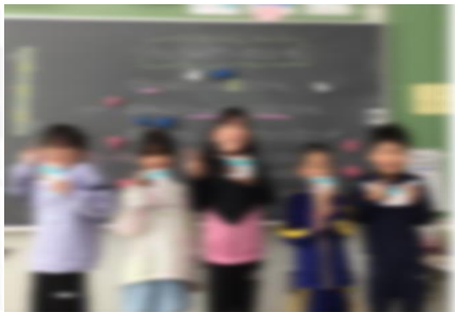
お店の人はIDカードを持っています。