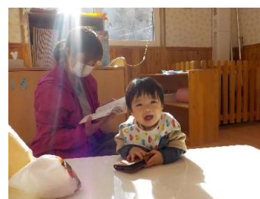
『あーあー！』 (大きい声出しています)