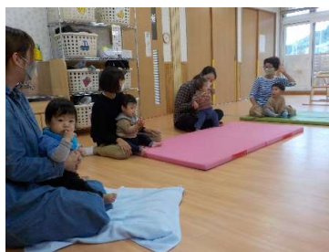
『みんなでわらべうた遊び』

〈最近の子どもの様子〉 小さな1歩ですが子ども同士で少しずつ関わり合う姿が見られます。