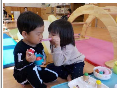
『あーんして。おいしい？』