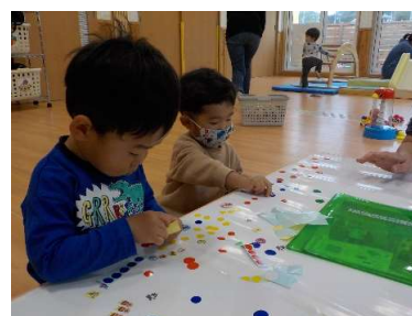
『1人が始めれば、ほくもとシール遊びに夢中です』

※よく顔を合わせるお友だちの名前を呼ぶ姿や近くにお友だちが寄ってきても受け入れる姿があります。