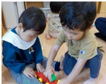
『どれどれつけてみよう』