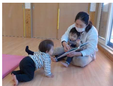
『仲良く絵本を見ています』