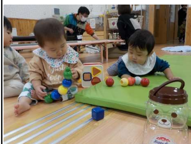
『一緒にじーっと見つめています。』