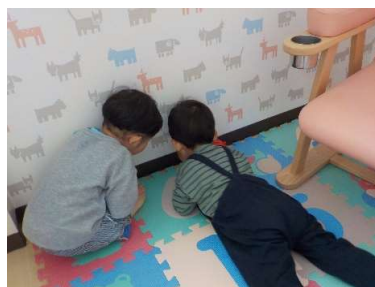
『なんかー』『なんかー』と言いながら虫を見ている2人