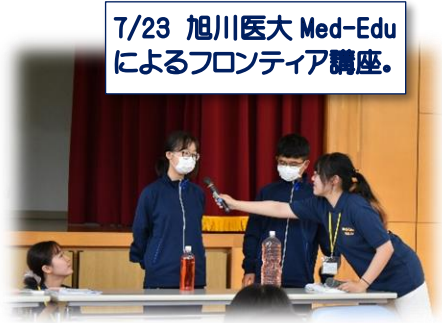
7/23 旭川医大 Med-Edu によるフロンティア講座。