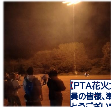
【PTA花火大会】 役員の皆様、準備ありがとうございました