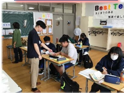
【夏の学習会】 北大の学生と様々な勉強をしました。