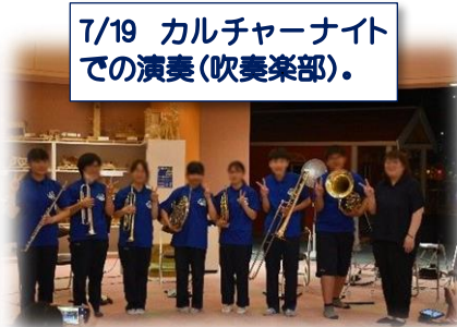
7/19 カルチャーナイトでの演奏(吹奏楽部)。