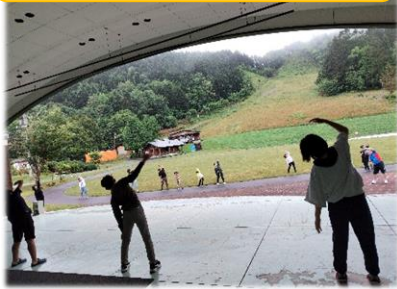
【ラジオ体操】 皆勤賞の生徒も。