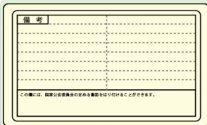
運転免許証の写し