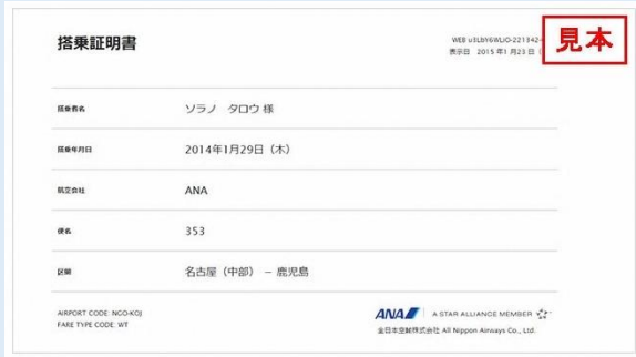
○ ご搭乗案内 (ピンク色) 又は